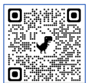
網址 QR Code